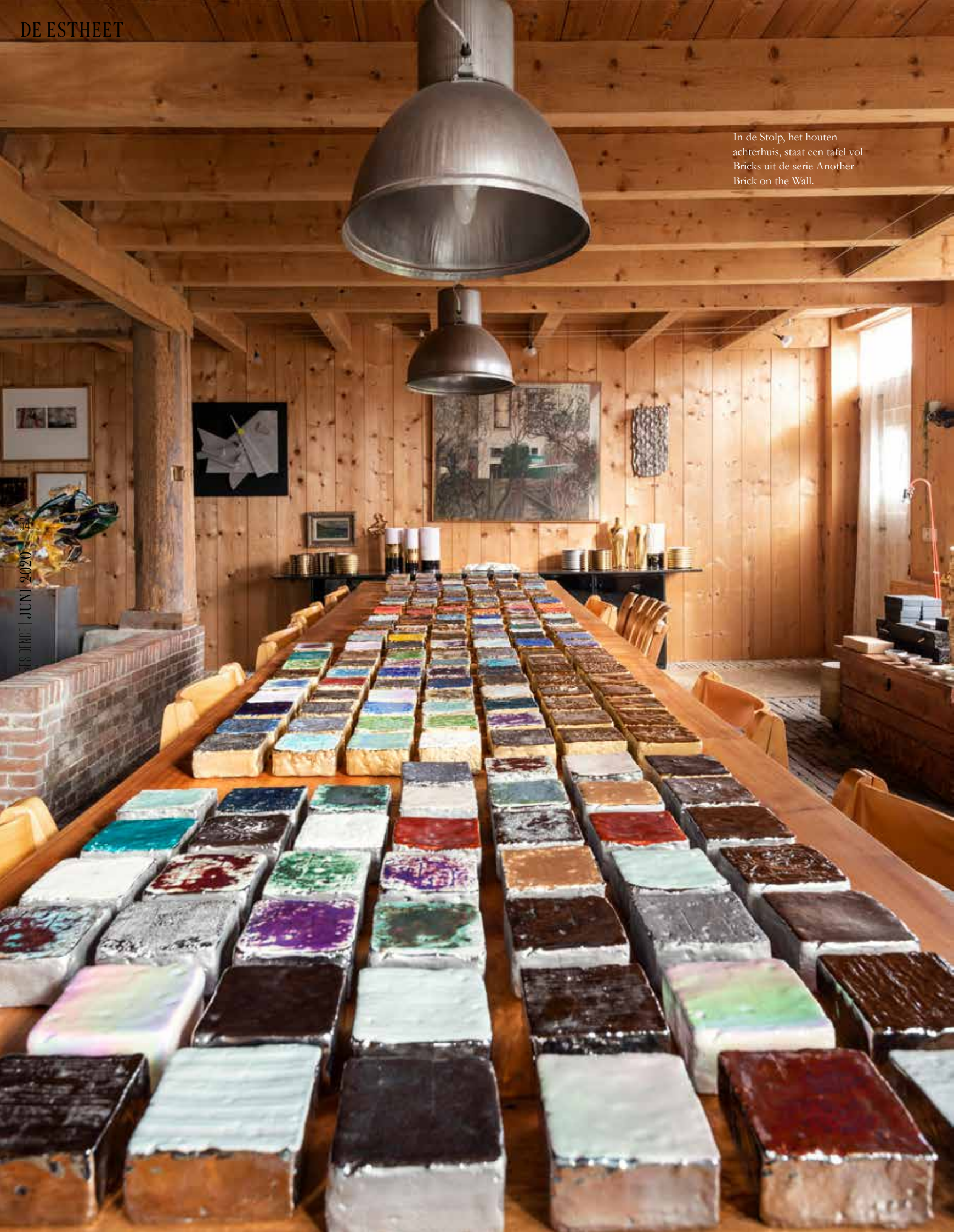
In de Stolp, het houten achterhuis, staat een tafel vol Bricks uit de serie Another Brick on the Wall.